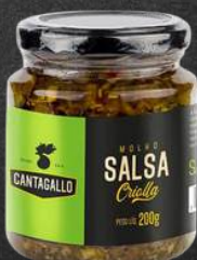
SALSA CRIOULA $29,90