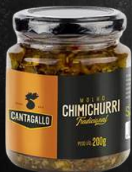
CHIMICHURRI TRADICIONAL $29,90