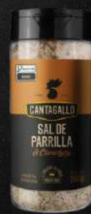
ORIGINAL C/ CHIMICHURRI $16,90